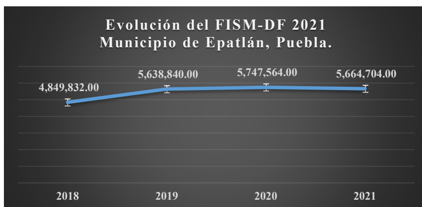
Gráfica 1: Evolución del FISM.

El presupuesto asignado para el Municipio de Epatlán Puebla, del Fondo de Aportaciones para la Infraestructura Social Municipal con base a los Periódicos Oficiales 6 muestran que durante los ejercicios de 2018 a 2021 tuvo un incremento del 16.80 %, No obstante, es importante hacer mención que, en el ejercicio fiscal 2021 el Municipio asumió un decremento en el presupuesto asignado por la cantidad de $82,860.00, respecto al ejercicio 2020.